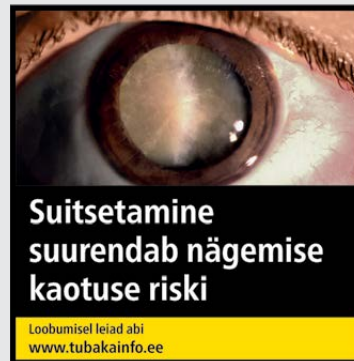
Rühm 3 pilt