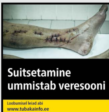
Rühm 2 pilt