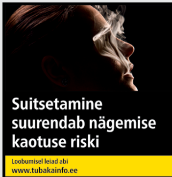
Rühm 2 pilt