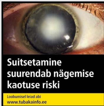
Rühm 1 pilt