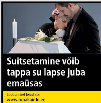
Rühm 1 pilt