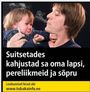
Rühm 1 pilt