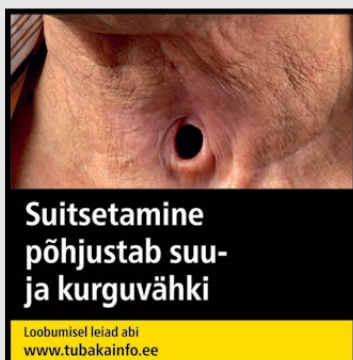
Rühm 1 pilt