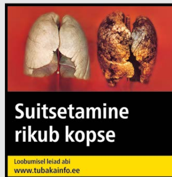
Rühm 3 pilt