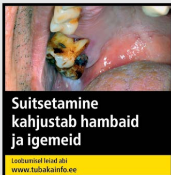
Rühm 1 pilt