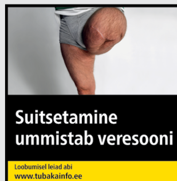
Rühm 3 pilt