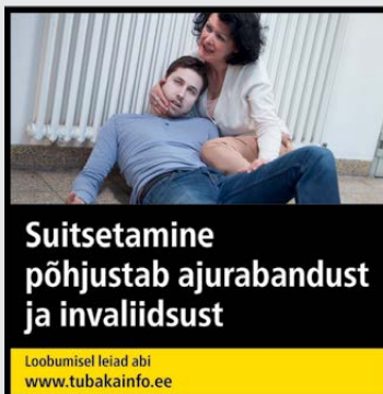
Rühm 2 pilt