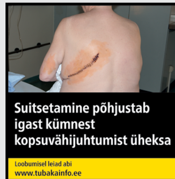
Rühm 3 pilt