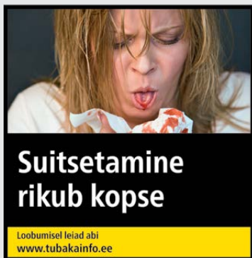
Rühm 1 pilt