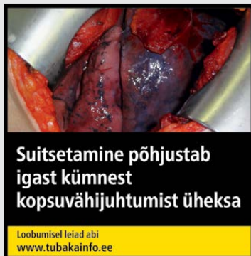
Rühm 1 pilt