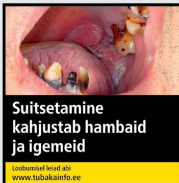
Rühm 2 pilt