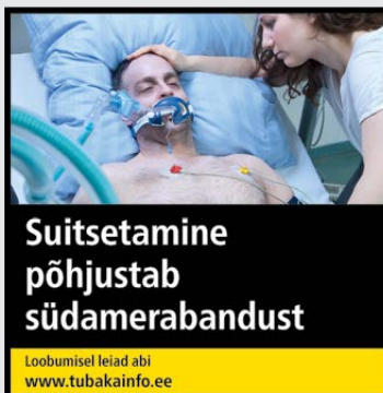
Rühm 2 pilt