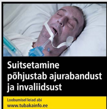
Rühm 1 pilt