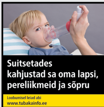
Rühm 2 pilt