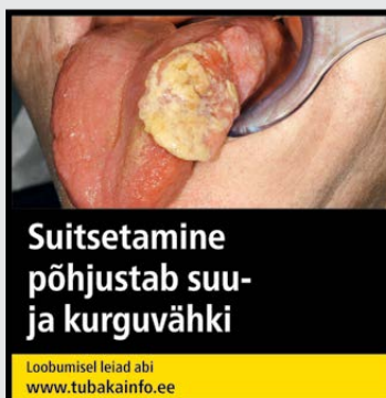
Rühm 2 pilt