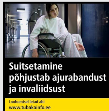
Rühm 3 pilt