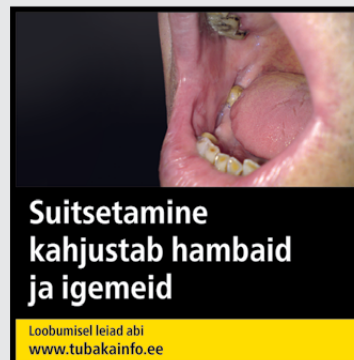
Rühm 3 pilt