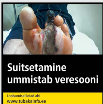
Rühm 1 pilt