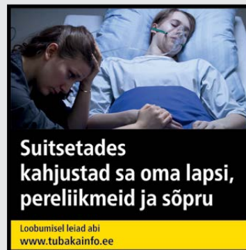
Rühm 3 pilt