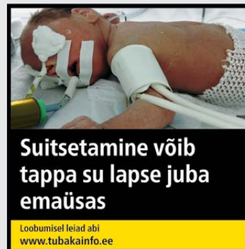
Rühm 3 pilt