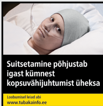
Rühm 2 pilt