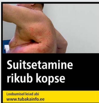
Rühm 2 pilt