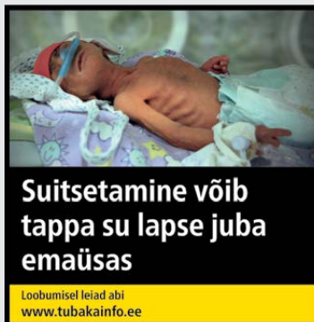
Rühm 2 pilt