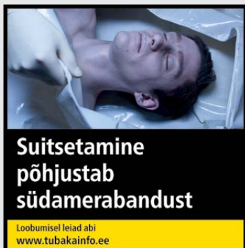
Rühm 1 pilt