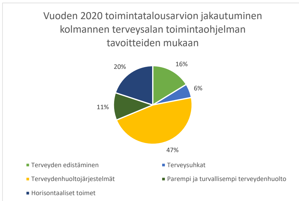
Kaavio 1: Vuoden 2020 toimintatalousarvion jakautuminen ohjelman tavoitteiden mukaan

Jäljempänä olevassa kaaviossa 1 esitetään määrärahojen jakautuminen eri tavoitteiden mukaan.