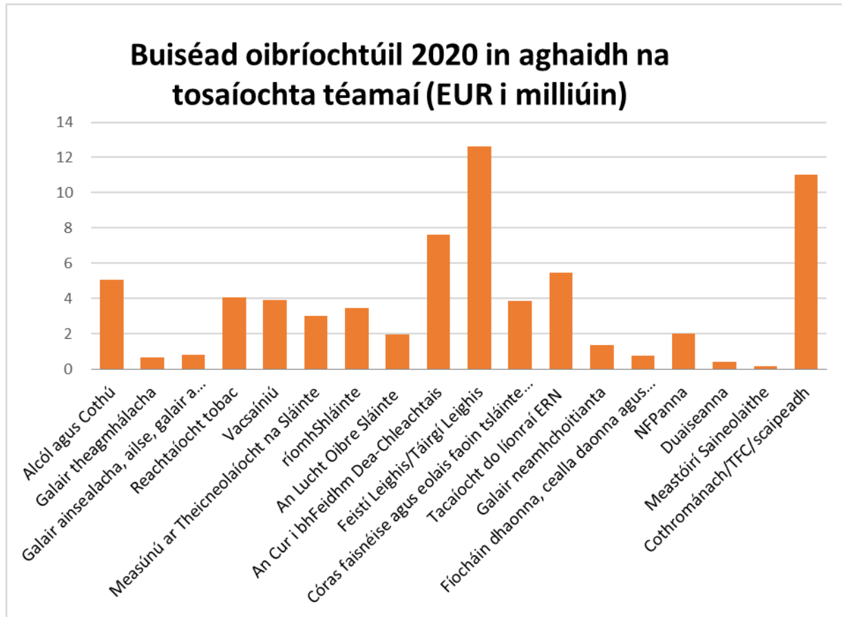
Cairt 2: Buiséad oibríochtúil 2020 de réir tosaíochta téamaí (i milliúin EUR)

Cuireadh an clár chun feidhme trí raon leathan ionstraimí maoiniúcháin. Orthu sin tá: