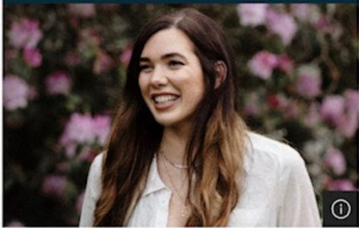
'She embraced life and lived it to the fullest, despite her lung cancer diagnosis at 28'