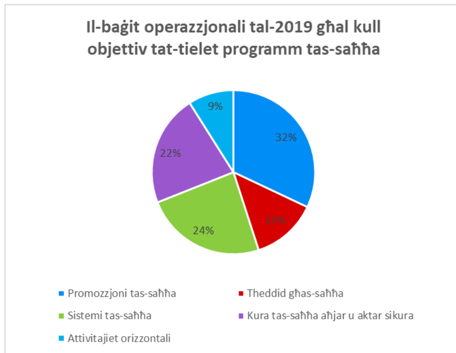
Ċart 1: il-baġit operazzjonali tal-2019 għal kull objettiv tat-tielet programm tas-saħħa

Fir-rigward tal-allokazzjoni tal-baġit tal-2019 għal kull waħda mill-prijoritajiet tematiċi tal-programm, iċ-Ċart 2 ta' hawn taħt turi li l-attivitajiet taħt il-prijorità tematika 1 għall-promozzjoni tas-saħħa, għall-prevenzjoni tal-mard u għat-trawwim ta' ambjenti li jappoġġaw stili ta' ħajja tajbin għas-saħħa jikklassifikaw fl-ogħla post, segwiti mit-tilqim, mill-apparati mediċi u mill-mard rari.